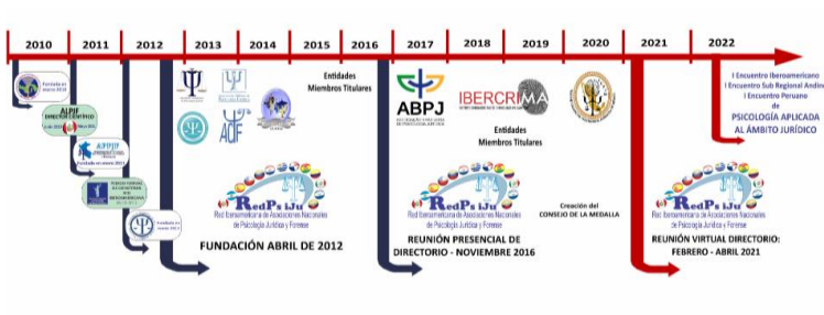
Figura 3 – Linha do Tempo dos processos de articulação gremial interinstitucional.

Em relação a isso, há uma "linha do tempo" que explica didaticamente o processo que norteia o desenvolvimento corporativo na perspectiva do fortalecimento da ciência psicológica aplicada ao campo jurídico.